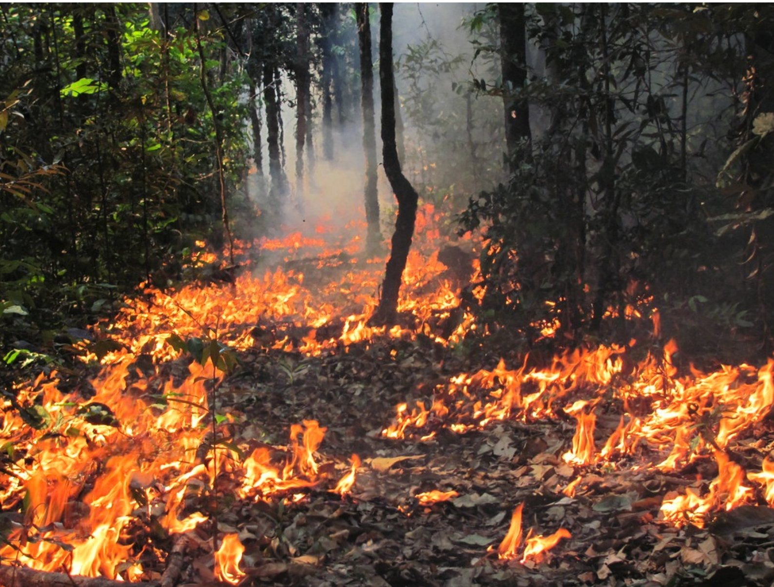
Experimento de pesquisa do IPAM, em Querência (MT).

A explosão do desmatamento e das queimadas, na Amazônia, ocorre em meio a uma crise social, econômica e sanitária no Brasil. O aumento das queimadas pode provocar, além dos prejuízos econômicos e ambientais já previstos, mais problemas graves de saúde, em plena pandemia do novo coronavírus.